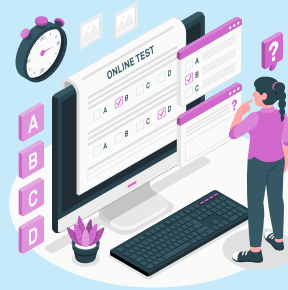
Online Test Series & Quiz